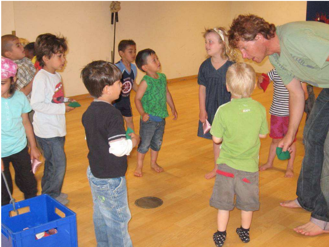
Fra projektet Pædagogisk idræt - en bevægende idræt